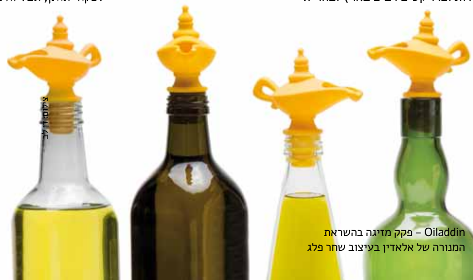
Oiladdin – פקק מזיגה בהשראת המנורה של אלאדין בעיצוב שחר פלג

היה בשנת 2000, יזם ישראלי ראה את העבודה שלנו בארץ והזמין אותנו להקים עבודת את מלון נוסטינגהם פארק פלזה באנגליה. משם זה התגלגל, עד היום בעצם. בעקבות הפריצה לחו"ל הפכנו