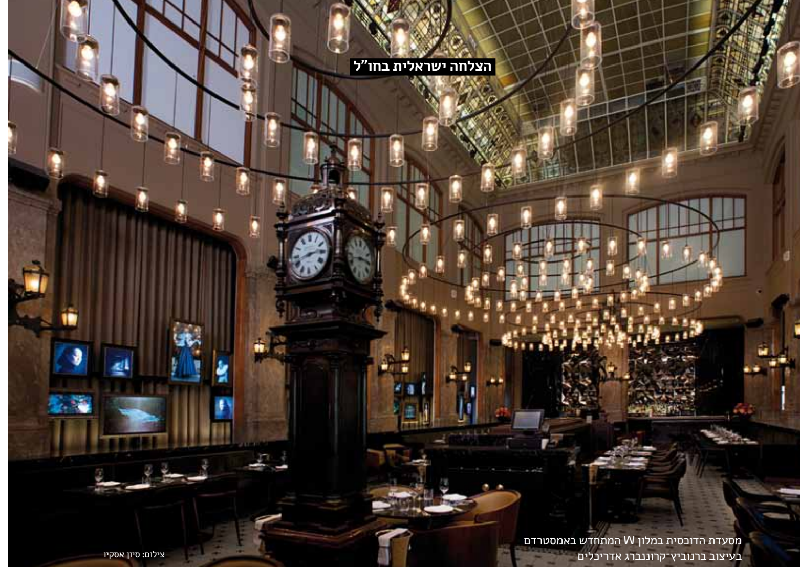
הצלחה ישראלית בחו"ל