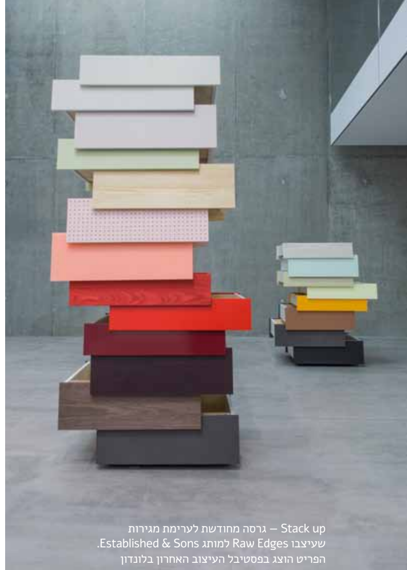
Stack up – גרסה מחדשת לערימת מגירות שיעצבו Raw Edges למותג Established & Sons. הפריט הוצג בפסטיבל העיצוב האחרון בלונדון