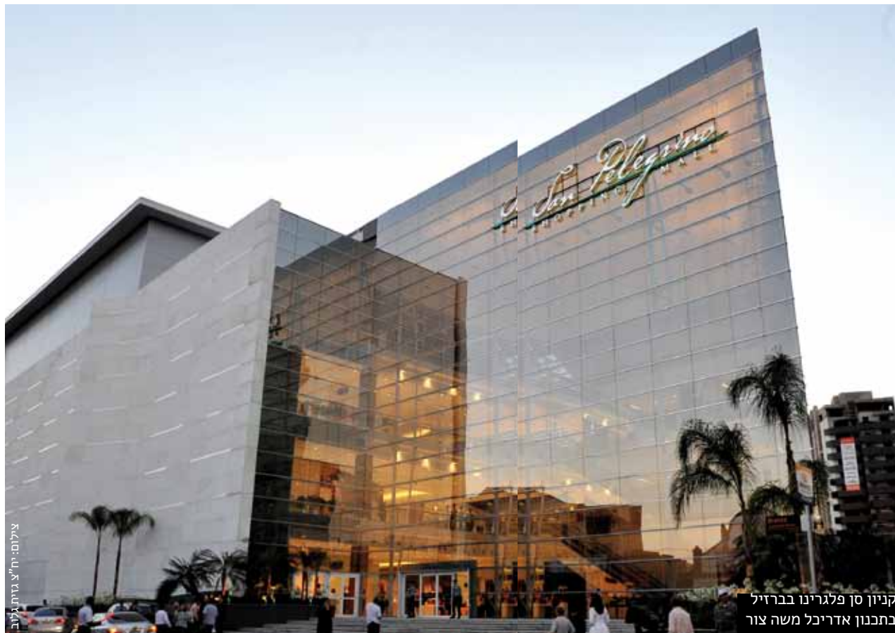
קניון סן פלגריןו בברזיל בתכנון אדריכל משה צור