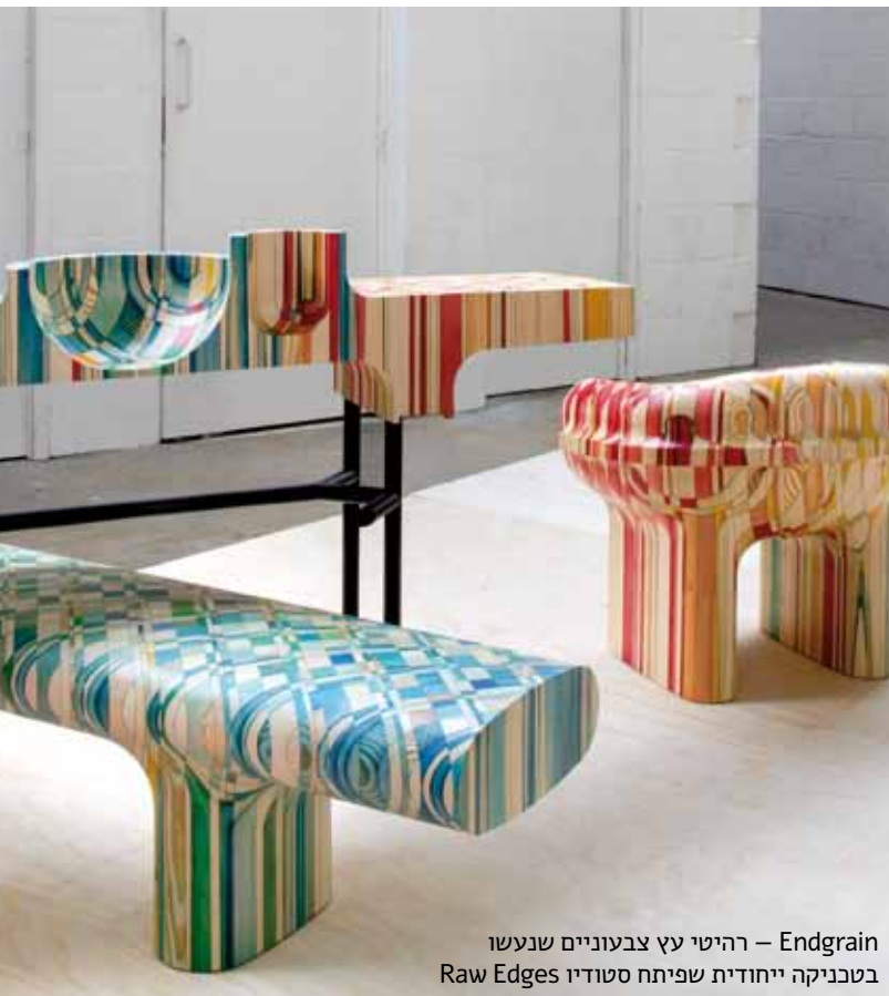
Endgrain – רהיטי עץ צבעוניים שנעשו בטכניקה ייחודית שפיתח סטודיו Raw Edges